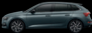
Grigio Quarzo Met.