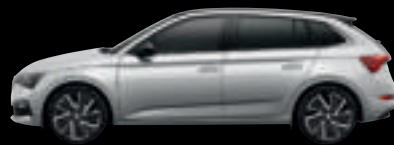
Argento Brillante Met.