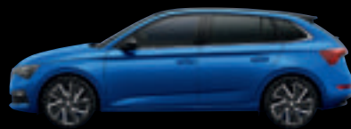
Blu Race Met.