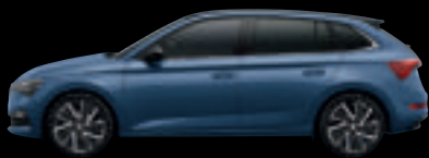
Blu Titanio Met.