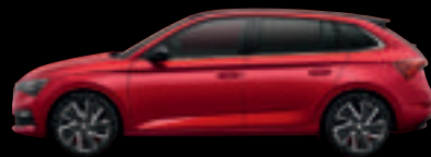
Rosso Velluto Met.