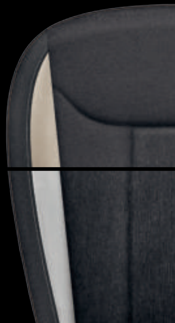
Style Beige* (tessuto / Tecnofibra ArtVelours)