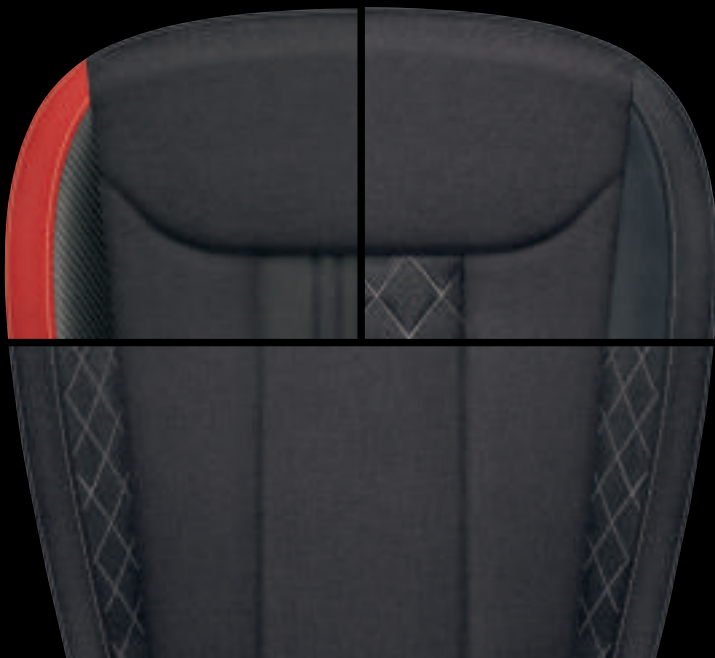
Sport (tessuto / Tecnofibra ArtVelours)