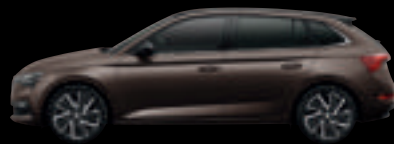
Marrone Tabacco Met.