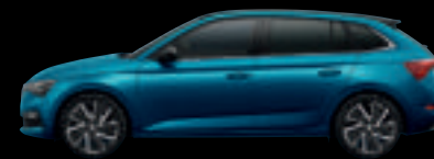
Blu Lava Met.