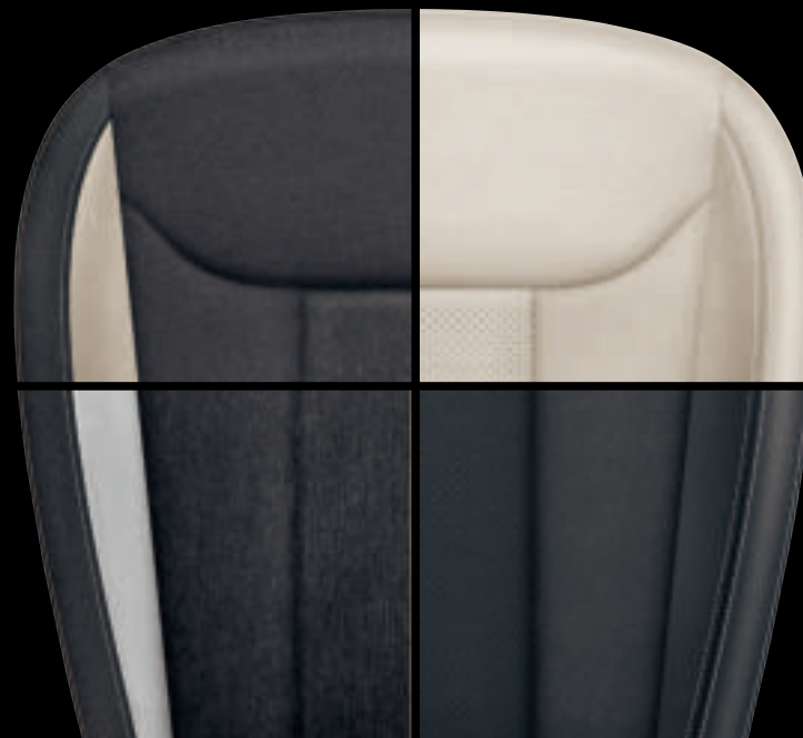
Pelle Beige* (pelle / Tecnofibra ArtVelours)