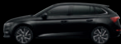
Nero Tulipano Met.