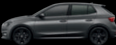
Grigio Graphite met.