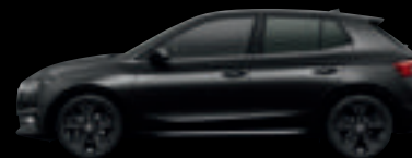
Nero Tulipano Perlato