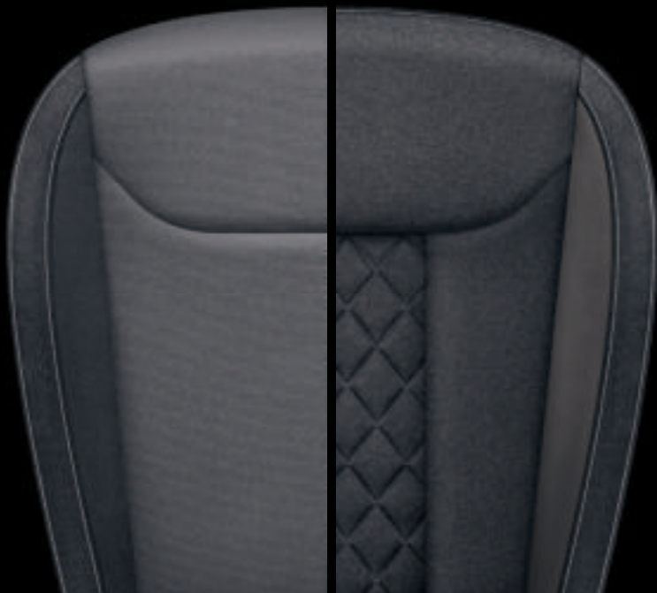
Sedili Sport Dynamic (tessuto nero / Tecnofibra ArtVelours grigia)