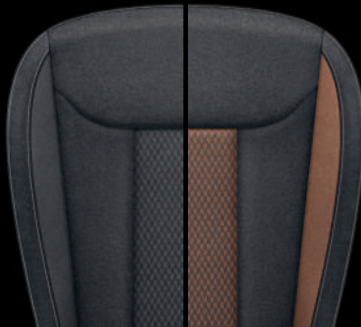
Style Nero/Copper (Tessuto Nero / Tessuto Copper / Trame Copper)