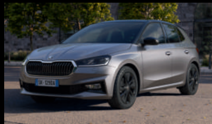
COLOR CONCEPT NERO