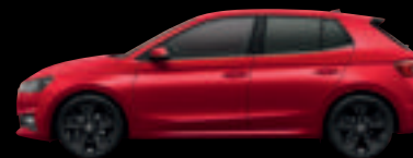
Rosso Velluto met.