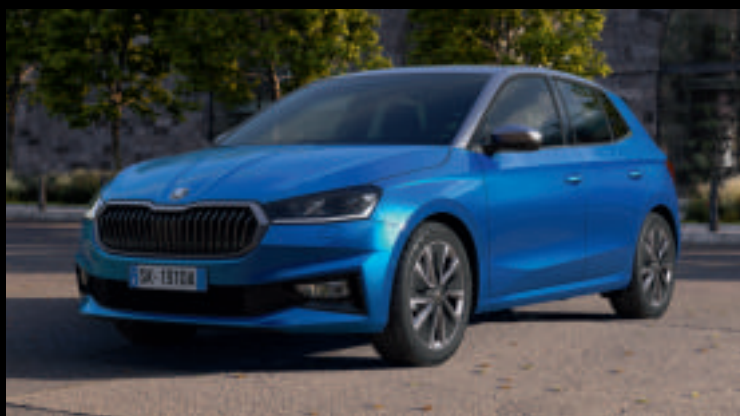
COLOR CONCEPT GRIGIO GRAPHITE

Personalizza il look della tua FABIA con il Color Concept, il pacchetto estetico che ti permette di combinare il tuo colore di carrozzeria preferito con un colore a contrasto come il Nero o il Grigio Graphite. Grazie alla doppia verniciatura, agli elementi di carrozzeria a contrasto e a un design dei cerchi in lega dedicato, la tua FABIA si distinguerà da ogni altra vettura.