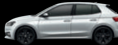
Bianco Luna met.