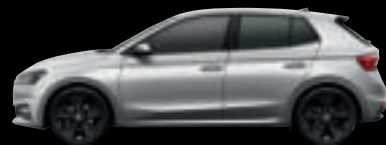
Argento Brillante met.