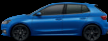
Blu Race met.