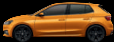
Arancio Sunset met.