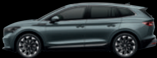
Grigio Quarzo Met.