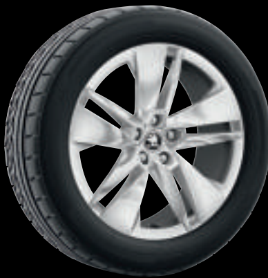
Cerchi in lega PROTEUS colore argento da 19"