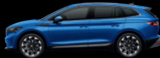
Blu Race Met.