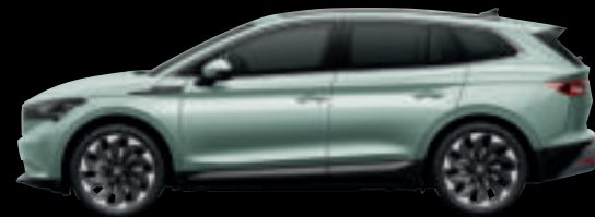
Grigio Artico Met.