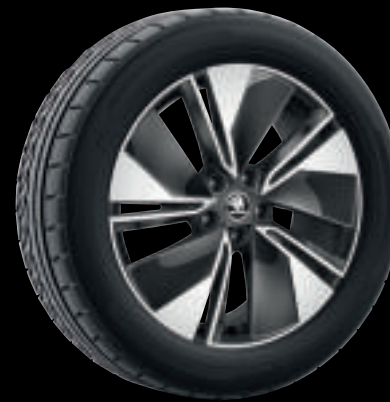
Cerchi in lega REGULUS colore antracite da 19"