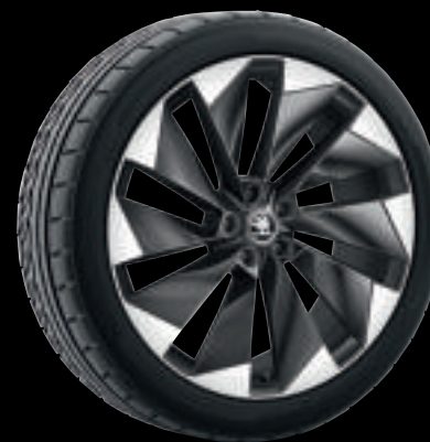
Cerchi in lega BETRIA colore antracite da 21"