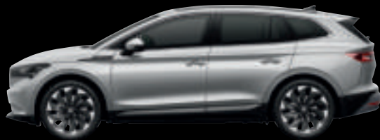
Argento Brillante Met.