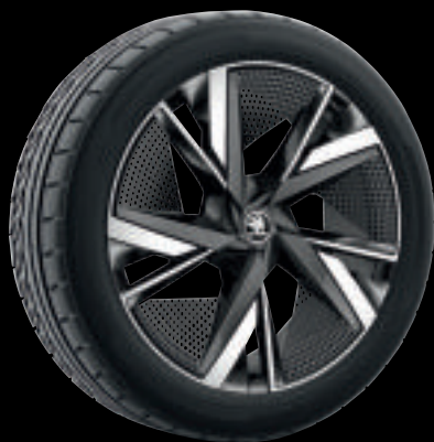
Cerchi in lega TAURUS colore nero da 20"