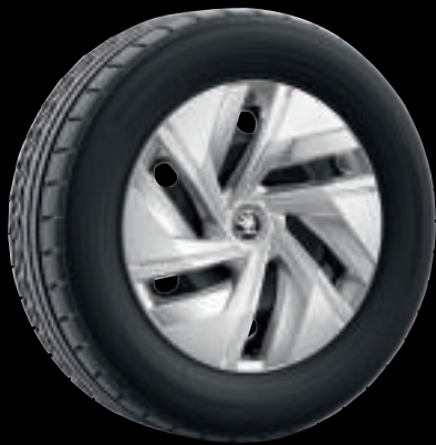
Cerchi in acciaio da 18" con copricerchio Andromeda