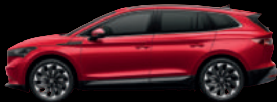
Rosso Velluto Met.