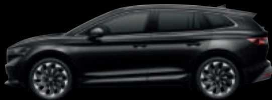
Nero Tulipano Perlato