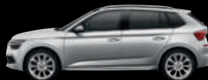
Argento Brillante Met.