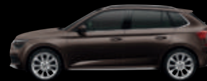
Marrone Tabacco Met.*