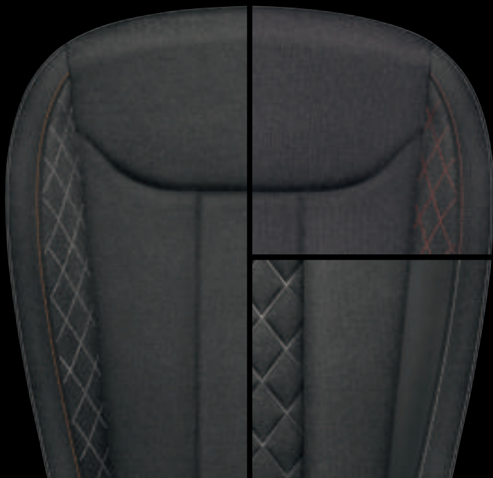
Ambition Nero/Rosso (tessuto nero/trame rosse)