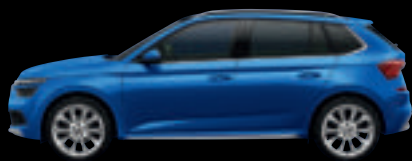
Blu Race Met.