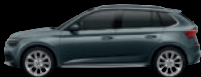
Grigio Quarzo Met.