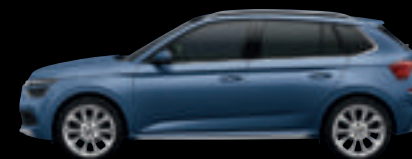
Blu Titanio Met.