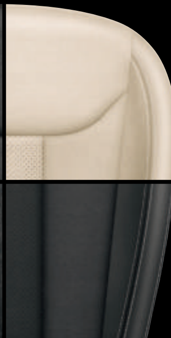
Pelle Nera (Tecnofibra ArtVelour nera / Pelle nera)