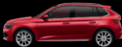
Rosso Velluto Met.