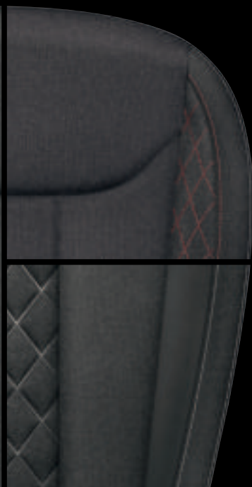
Sedili Sport Nero (Tessuto Nero / Tecnofibra ArtVelours Nero)