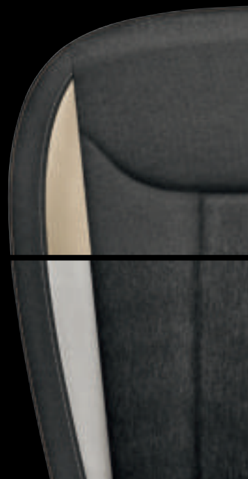
Style Nero (Tessuto Nero / Tecnofibra ArtVelours Grigia)