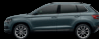
Grigio Quarzo met.