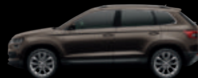
Marrone Magnetico met.