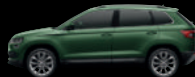
Verde Smeraldo met.