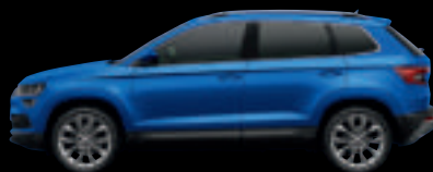
Blu Race met.