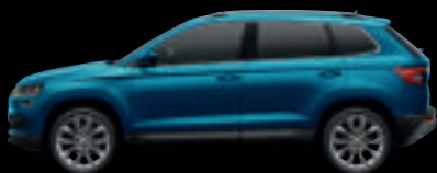
Blu Lava met.