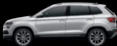
Argento Brillante met.