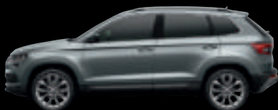
Grigio Business met.