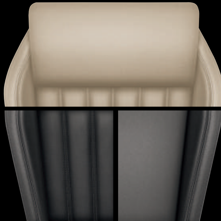
Interni Style Pelle nera