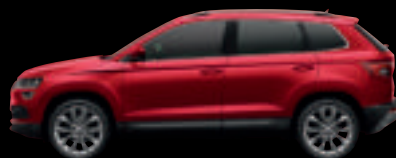
Rosso Velluto met.