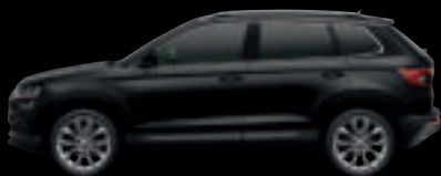
Nero Tulipano Met.